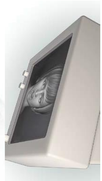
Blair et al., 2014